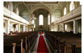
Totale Blickrichtung Altarraum

Ab 22.00 Uhr sind die gesetzlichen Lärmschutzbestimmungen einzuhalten. Zwischen 22 und 8 Uhr herrscht Fahr- und Lieferverbot auf dem gesamten Gelände. Rauchverbot in allen Räumen.