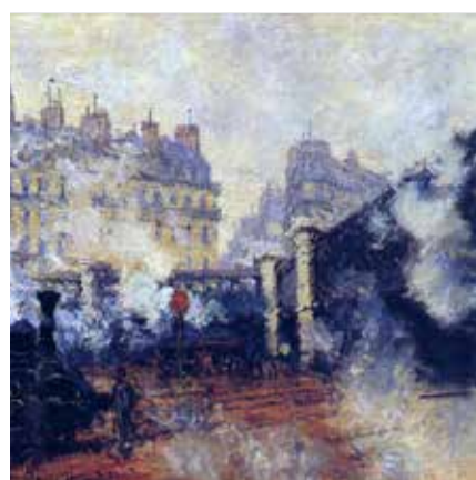
Claude Monet, Le Pont de l'Europe-Gare-Lazare, 1877