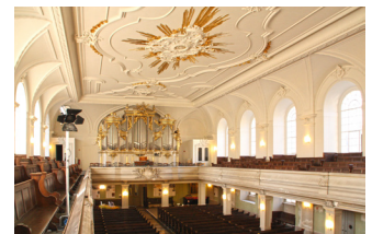
Empore Blickrichtung zur Schuke-Orgel