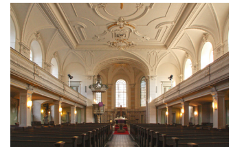
Blickrichtung zur Apsis, EG: 500 m 2