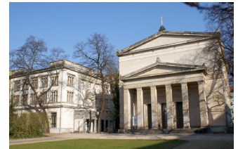
Außenansicht St. Elisabeth mit Villa

Dann freuen wir uns über Deine Bewerbung mit Motivationsschreiben, Lebenslauf (gern mit Foto) und Zeugnissen per E-Mail bis zum 31.03.20 an thekla.wolff@elisabeth.berlin