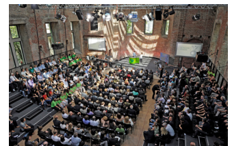
Preisverleihung durch Angela Merkel